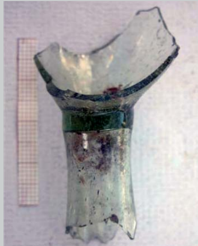
STELO DI BICCHIERE, VII-VIII SECOLO (SMALL).

perlomeno una certa organizzazione in grado di accumularlo e, in una certa misura, ridistribuirlo? Oltretutto, tornando al tesoretto, perché le monete non erano mai circolate? Erano state forse prodotte in loco oppure commissionate, o sono