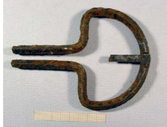
SCACCIAPENSIERI IN FERRO, LIVELLI XIII SECOLO (SMALL).

UN'IMMAGINE CHE DIMOSTRA QUANTO VICINE SIANO LE MURA DELLE CAVE.