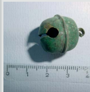
A DESTRA: TINTINNABOLO IN BRONZO, IN USO DAL XIII AL XIV-XV SECOLO (SMALL).

Fu dunque questa la ragione del massiccio attacco descritto in apertura? Possibile, ma probabilmente non lo sapremo mai con certezza. L'archeologia conosce anche dei limiti ben precisi. Ad ogni modo, ogni dettaglio, ogni nuovo elemento permette di addentrarci sempre piú in questo mondo affascinante, assai piú complesso di quanto si potesse immaginare. È dunque una scommessa già vinta in partenza affermare che sia solo questione di tempo prima che il sito di Tremona ci riservi la prossima sorpresa. ▲