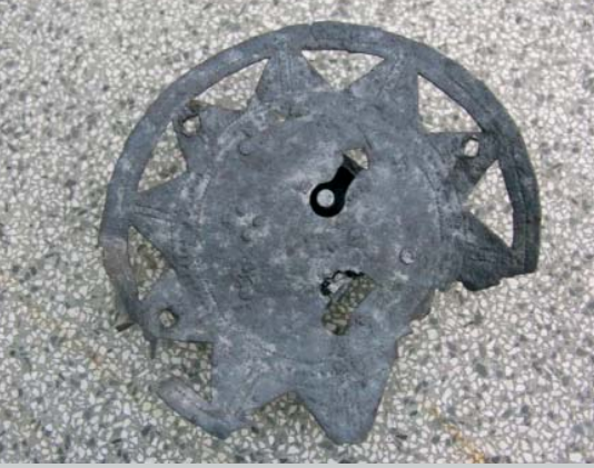
SERRATURA DA CASSAPANCA IN LAMINA DI FERRO, XIII SECOLO).

solo di un villaggio rurale? Oppure c'era qualcosa di piú nell'aria, pardon, nel terreno? Con il proseguimento delle ricerche, il tesoretto di 845 monete d'argento, scoperte già nel 1991, ha suscitato dubbi e domande non indifferenti sulla natura dell'insediamento. Come si potevano concordare l'ipotetico aspetto rurale del villaggio e questa notevole ricchezza? E come potevano dei semplici contadini permettersi di chiamare maestranze specializzate per costruire taluni edifici, come sembra assodato dall'analisi delle mura? Anche molti oggetti di uso quotidiano, ad esempio le fibbie di bronzo finemente lavorate, sembrano eccessivamente lussuosi, in disaccordo con l'immagine ricorrente del pastore/contadino medioevale. Testimoniano forse un certo benessere, forse una classe dominante o