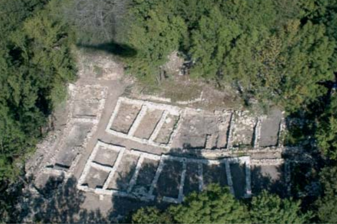
FOTOGRAFIA AEREA DEL SITO DI TREMONA.

studia i nomi di luogo) con l'indicazione del nome dell'altura chiamata per l'appunto Castello. Ad ogni modo questo fatto non deve sorprendere. Molti altri siti archeologici disseminati sul nostro territorio sono stati scoperti grazie a queste effimere, seppure vaghe indicazioni. In effetti, il termine castello, come caslac e castelrotto per citare gli esempi piú tipici, può riferirsi alla presenza di antiche strutture in muratura. Tuttavia, a scampo di equivoci, non tutte le rovine fissate dalla fantasia nell'immaginario passato remoto sono però sempre antiche e anche in questo frangente fu dunque necessario procedere ad una verifica sul campo.