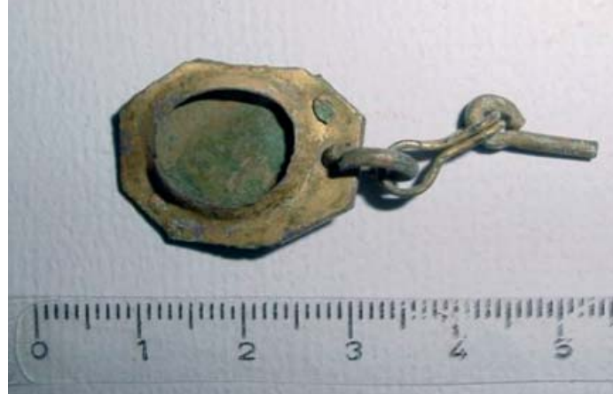
PORTA CAMMEO IN LAMINA DI BRONZO DORATA E FRAMMENTO DELLA CATENINA DISO.

Le case finora indagate, addossate le une alle altre, potrebbero aver posseduto solo il pianterreno, sebbene almeno in un caso due canali di scarico integrati nel muro dimostrino l'esistenza di un piano superiore. L'abitato, dunque ravvicinato e stretto, con strade ben definite e in terra battuta, un tempo certamente brulicanti di vita, si deve immaginare completato anche dagli animali più piccoli come i cani, i gatti e anche il pollame che doveva vivere in stretto contatto con gli uomini, mentre poco fuo-