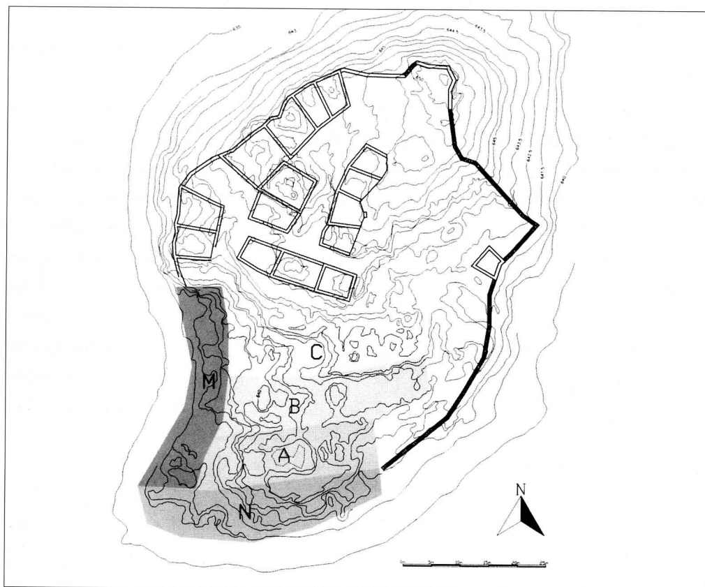
3A: Übersichtsplan der gegrabenen Flächen A, B, C, M und N.